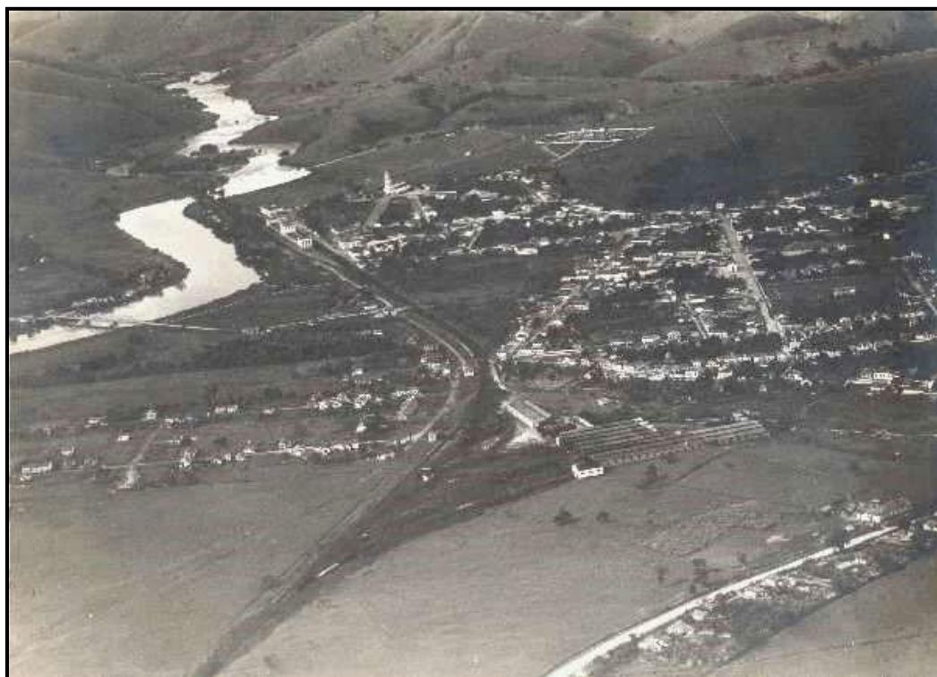
Cachoeira Paulista: Vista geral do núcleo urbano, observa-se orla ferroviária e ponte sobre o rio Paraíba do Sul. 9

Dados fornecidos pelo SEADE 10 referentes ao Ensino Médio na região, para o ano de 2021, assinalam que há total de 1.211 matrículas no município de Cachoeira Paulista, considerando as redes pública e privada. Nos municípios limítrofes a Cachoeira Paulista, portanto inseridos em área de influência da Faculdade Canção Nova (Canas, Cruzeiro, Lorena, Piquete e Silveiras), o número total de matrículas no Ensino Médio, também relativo ao ano de 2021, chegou a 8.331 matrículas.